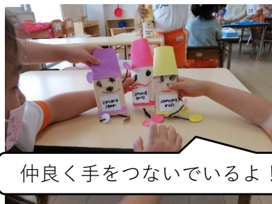
仲良く手をつないでいるよ!