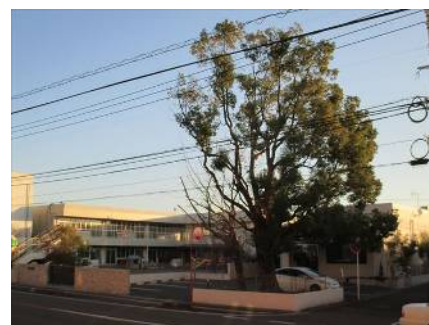
初日に映える園舎と樹木

本紙No.3 2でもお知らせしましたが、保育園部前のE駐車場の樹木2本の伐採作業及び駐車場の整備を1 2日(土)からの3連休から始めます。イチョウとクスが大きいので、高所作業車を使用する関係で、作業期間中はE駐車場が利用できなくなります。また、伐採後は、駐車スペースとして整備します。できるだけ土日を使って作業をしますが、土曜日については、保育園部の保護者の皆さんは園庭に駐車してください。しばらくご不便をおかけしますが、よろしくをお願いします。