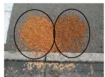
2種類まかれました。